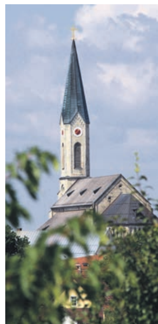
Bei der „Licht Zeit Reise“ wird heuer der Bayerwald-Dom ins spektakuläres Licht getaucht

Die weiteren sieben Figuren kamen dann auf Betreiben des Heimat- und Museumsvereins in den vergangenen Jahren dazu: der Herr Marktrichter, der Gastwirt, das Hackinger Marerl, der Chirurg, der Säumer, der Torwächter und zuletzt der Kaufmann. Bis auf den „Ewigen Hochzeiter“ wurden alle von dem Waldkirchner Künstler Manfred Werner geschaffen.