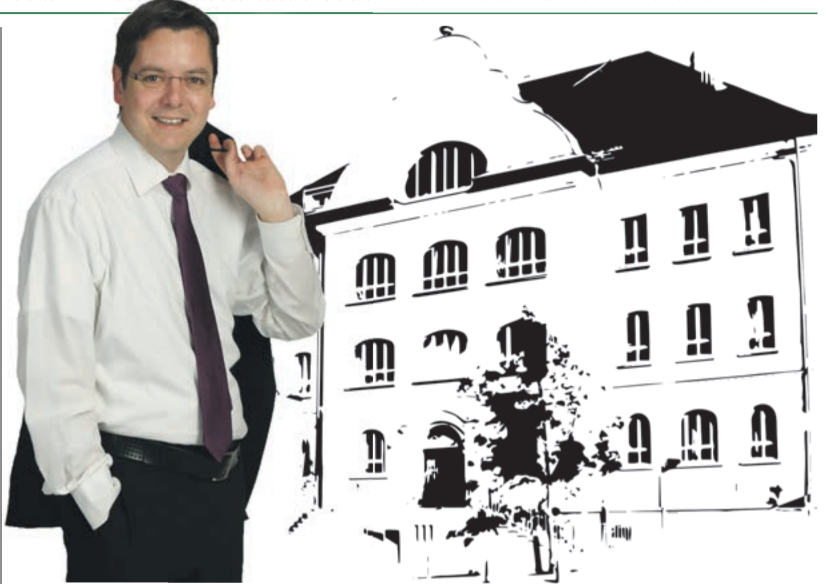
Der Kampf ums Bürgermeisteramt ist entschieden: Die Waldumschau gratuliert Heinz Pollak zum Wahlsieg und wünscht eine erfolgreiche Amtsperiode 2014 bis 2020!

Von uns gibt's deshalb weder Gscheidhaferl-Kommentare noch gute Ratschläge. Nur einen Wunsch: Lieber Bürgermeister, liebe Stadträte der Jahre 2014 bis 2020: Steckt uns an mit Eurer Begeisterung! Das kostet die Stadt keinen Cent. Aber wir könnten ziemlich reich damit werden.