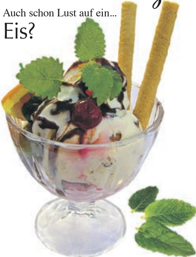
Eis kann auch gesunde Zutaten enthalten