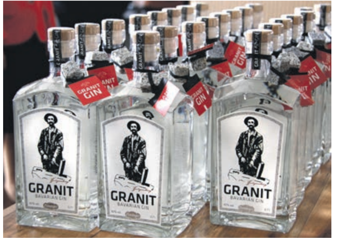
Der bayerische Gin „GRANIT“ besticht mit seinem markanten Design. Der Clou: ein kleiner Steinkubus am Flaschenhals, den man wie einen Eiswürfel verwenden kann.