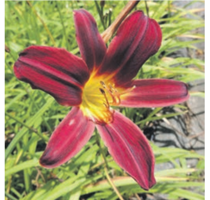
Wird ihre Pracht zeigen: die Taglilie

Sieben Jahre nach der Landesgartenschau in Waldkirchen findet heuer die Landesgartenschau in Deggendorf statt - vom 25. April bis 5. Oktober. Wie bei uns damals ist eine große Aufbruchsstimmung und Vorfreude spürbar. Weit über 3000 Veranstaltungen bereichern das Programm. Im Zentrum der Großveranstaltung steht die Donau – sowohl als Lebens- und Naturraum als auch als verbindendes Element zwischen den Kulturen.