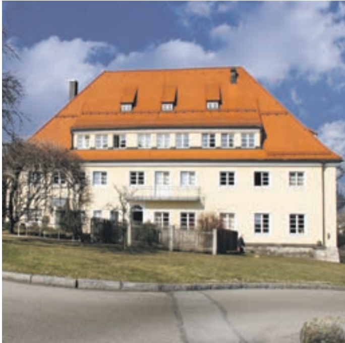
Optisch markant: das Landwirtschaftsamt

Es ist eines der imposantesten Gebäude im Stadtbild: Das „Landwirtschaftsamt“ in der Bahnhofstraße 18. Blickt man von außerhalb aus geeigneter Richtung auf Waldkirchen, bleibt irgendwann der Blick daran hängen, nicht zuletzt wegen des gewaltigen Daches. Aus der Nähe beeindruckt die großen steinernen Treppen, die man von der Bahnhofstraße herkommend emporsteigt. Das Haus wurde als Landwirtschaftsschule 1925 erbaut, der datierte Grundstein ist gleich vis-à-vis der Eingangstür eingemauert. 1972 ging aus der Landwirtschaftsschule das Landwirtschaftsamt hervor. Bereits in seiner Anfangsphase war das Amt schon einmal eine Außenstelle der „Dienststelle Regen“, damals noch „für Landwirtschaft und Tierzucht“, und zwar bis 1985. 1986 gründete es sich neu und war bis 1997 von Regen unabhängig.