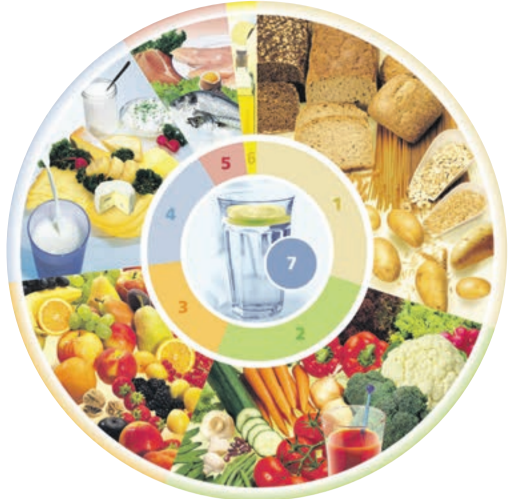
DGE-Ernährungskreis®, Copyright: Deutsche Gesellschaft für Ernährung e. V., Bonn

Neben dem Ernährungskreis gibt's die sogenannten 10 Regeln, die von der DGE schon seit dem Jahr 1956 formuliert und nach den neuesten wis-