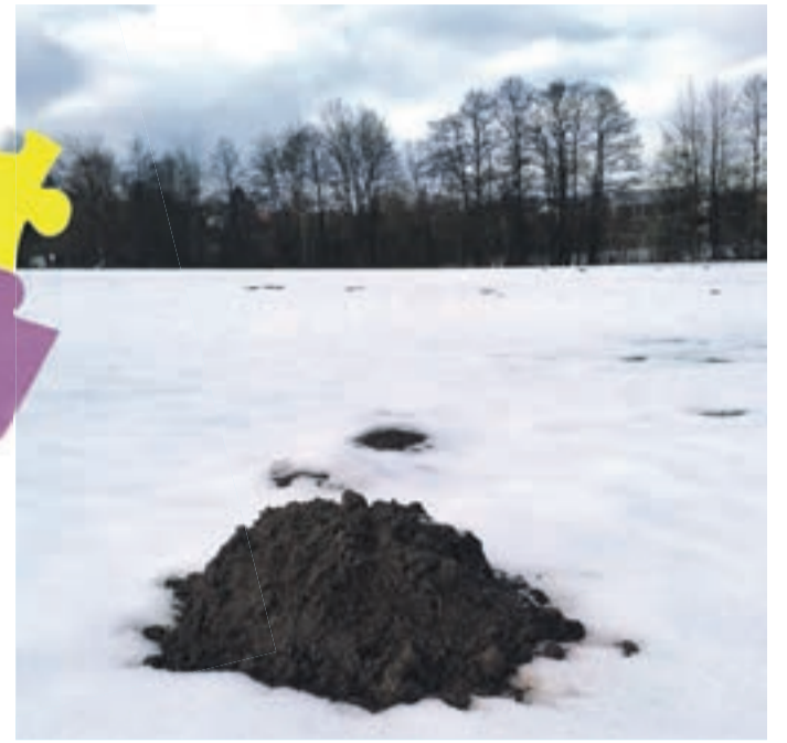
Maulwurfhügel – die andere Art von „Buckelpiste“

Hügel über Hügel: Wer in den letzten Wochen über Wiesen und Felder spazierte, stolperte von einem Erdhaufen zum nächsten. Was um diese Jahreszeit normalerweise unter einer Schneedecke verborgen ist, wurde in den letzten Wochen offensichtlich: Die Maulwürfe sind auch im Winter regelrechte Workaholics. Ein junger, vitaler Wühler kann täglich um die 20 Erdhügel produzieren, heißt es. Dabei ernährt er sich ausschließlich von Insekten und deren Larven. Weit oben auf seinem Speiseplan stehen neben dem Regenwurm beispielsweise die im Boden lebenden Schädlingslarven von Dickmaulrüssler, Maikäfer und Wiesenschnake.