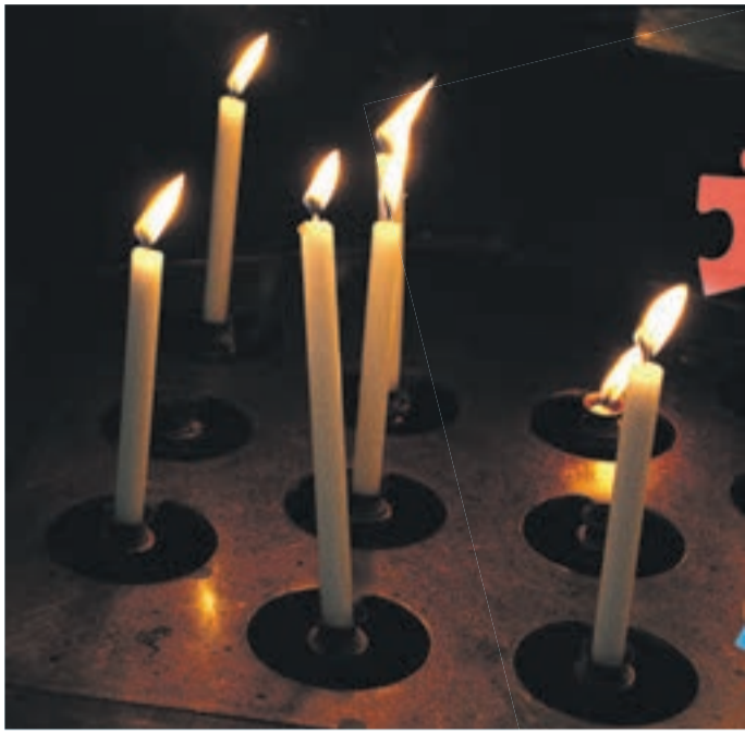
Kerzen als Symbol für Mariä Lichtmess