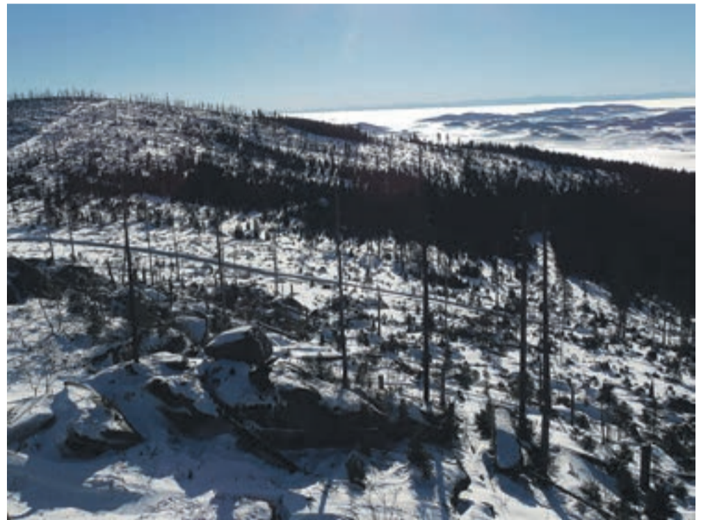
Wer auf den Dreisesselberg steigt, wird immer mit herrlichen Landschaftsmotiven belohnt. Diese Fotos stellte uns Jürgen Simon zur Verfügung. Sie entstanden Mitte Dezember, als der erste Schnee das Land überzogen hatte. Besonders reizvoll aufgrund seiner Wetterlage ist natürlich das hochformatige Bild: