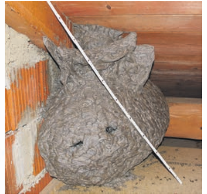
Ein Prachtwerk: das etwa 80 x 50 cm große Nest

Ein Wespennest größer als ein Autoreifen. Da hat selbst der Waldkirchner Biologe Günter Maier gestaunt, als er jetzt das imposante Werk auf dem Dachboden eines Wohnhauses am Bahnhof besichtigen durfte. Die Bewohner hatten sich zuvor auf die Suche nach der Heimstätte des tierischen Volkes gemacht, nachdem sie immer wieder von einzelnen Wespen in den Wohnräumen belästigt worden waren. In einer Ecke des Speichers wurden sie fündig. Es handelt sich um ein Nest der Gemeinen Wespe ( Vespa vulgaris ).