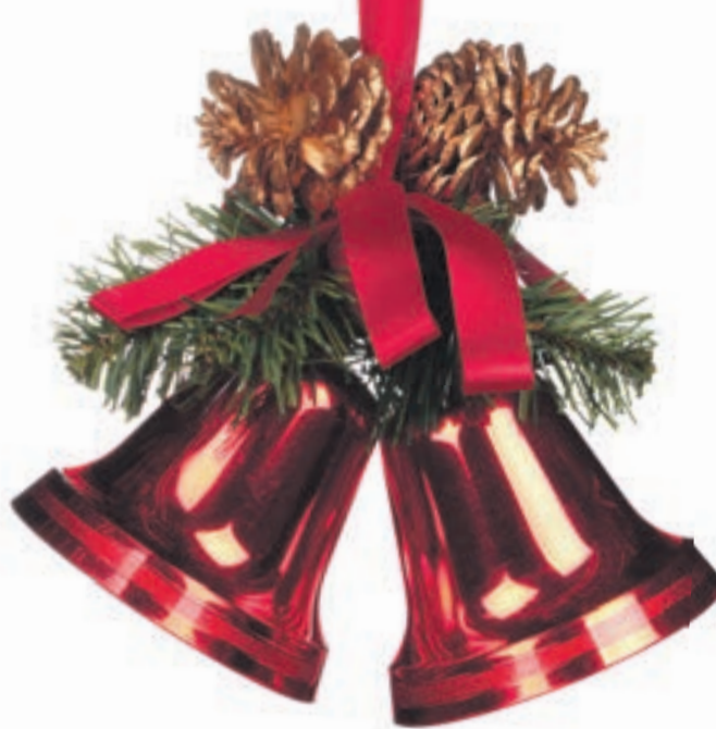
Rot bleibt ein weihnachtlicher Klassiker

Adventszeit ohne Tannenzweige, Sterne, Kerzen und Lichterglanz? Unvorstellbar. Kaum ist es Herbst geworden, begegnet man überall schon einer schier unendlichen Fülle an Deko-Artikeln. Und wenn wir Ende November endlich Lust bekommen, unsere Häuser und Gärten damit zu schmücken, denken sich die führenden Köpfe der Branchen schon wieder was Neues für das übernächste Fest aus. Vom 24. bis 28. Januar findet in Frankfurt die „Christmasworld“ statt, die weltweit größte Leitmesse für Dekoration und Festschmuck. Sie verspricht „außergewöhnliche Inszenierungen“, „kreative Impulse“ und ein Rahmenprogramm mit „einzigartigen Erlebnis- und Businesswelten“.