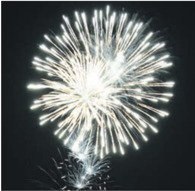
„Lustfeuerwerkerei“ zum Start ins neue Jahr, Foto: © Marinkovic

An Silvester wird munter drauflos geballert. Das neue Jahr wird mit einem bunten Farbenspiel am Himmel willkommen geheißen - mit Kugelbomben, Römischen Lichtern, Lanzenlichtern, Böllern, Leuchtsternen, Flammentöpfen und und und. Das Feuerwerk stammt ursprünglich aus China, wo bereits seit dem 8. Jahrhundert eine explosive Mischung zum Einsatz kam, die heute unter dem Namen Schwarzpulver bekannt ist und zum Teil die gleichen Stoffe enthält: Salpeter, Schwefel und Holzkohle.