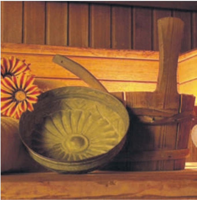
Schwitzen härtet ab, Foto: © Mumcu

Sauna tut gut, vor allem jetzt in der kalten Jahreszeit. Körperliche Erholung, seelisches Wohlbefinden, psychische Entspannung und Abhärtung gegen Krankheiten sind der Lohn für regelmäßige Schwitzkuren. Zunächst einmal wird die Durchblutung angeregt, denn die Körpertemperatur erhöht sich spürbar während eines Saunagangs. Es kommt zu einer Art künstlichem Fieber. Der Wechsel zwischen dieser Hitze, kalter Dusche und normaler Raumtemperatur ist es, der den Körper stark macht und wie ein passives Kreislauf-Training wirkt.