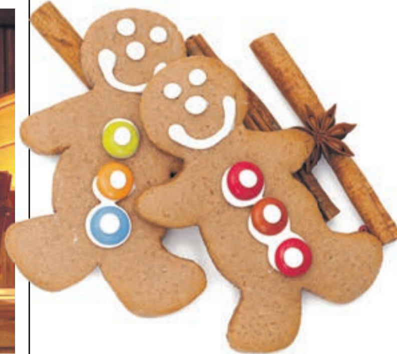
Lebkuchen haben eine wohltuende Wirkung, Foto: © Renaters

Lebkuchen ist etwas ganz besonderes. Früher konnte man ihn nicht so einfach selber herstellen, weil die vielen Gewürze und der Honig teuer und schwer zu bekommen waren. Außerdem hatten die wenigsten Normalbürger einen eigenen Backofen. Aus dem Bäckerstand heraus kämpften die „Lebzelter“ lange darum, um 1629 als eigener Berufsstand anerkannt zu werden.