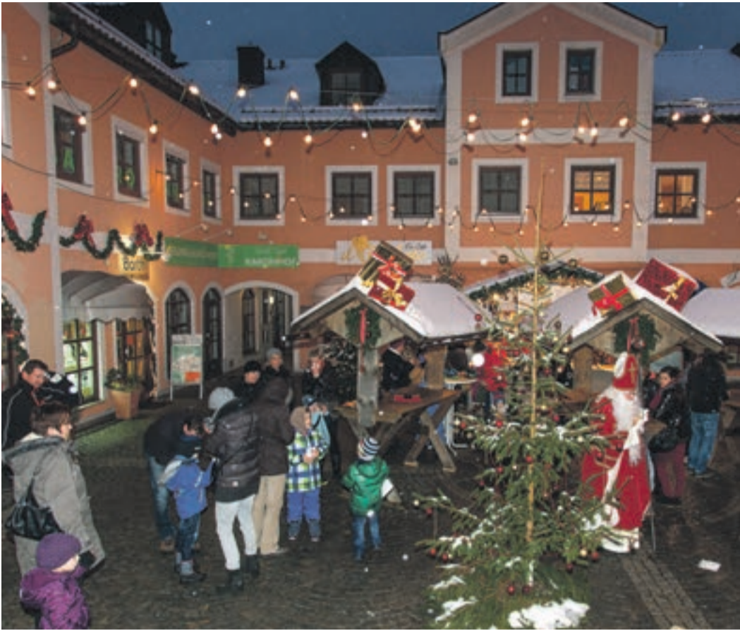
Weihnachtliches Flair hat der Baronhof ab 27. November zu bieten

Von 27. November bis 5. Januar – Live-Musik im Programm – Auch der Nikolaus kommt