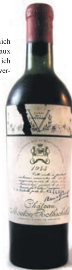
Erst vor Kurzem verkauft: Eine Flasche Château Mouton Rothschild 1945 – eine Legende unter Weinliebhabern.

wo niederlassen, wo man Skifahren und Golfspielen kann. Hier kann man beides. Zuerst wollte ich nur ein paar Jahre bleiben und dann nach London zurückkehren. Aber schließlich bin ich da geblieben. Heute möchte ich nicht woanders wohnen – auch wenn ich mir wünsche, die Winter hier wären um einiges kürzer.