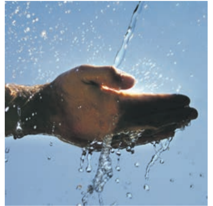
„Waldwasser“ ist eine geschützte Marke

Gletscherwasser aus der Eiszeit, Regenwasser aus Tasmanien oder Gebirgswasser aus Japan, die Flasche für 124 Euro: In manchen deutschen Restaurants wird den Gästen sündteures Wasser serviert, das oft tausende von Kilometern Transportwege hinter sich hat. Mit „Waldwasser“ will die Wasserversorgung Bayerischer Wald dem aberwitzigen Kult um die Luxuswässer jetzt begegnen, denn Wasser aus den glasklaren Quellen des Bayerischen Waldes braucht den Geschmacksvergleich mit horrend teuren Wässern aus aller Welt nicht zu scheuen.