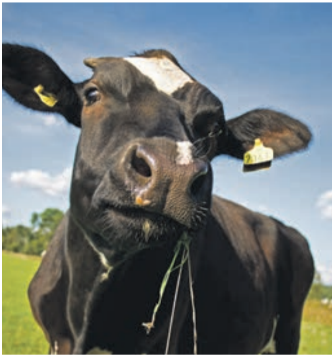
Für Veganer sind Tierprodukte absolut tabu

Die Grünen werben für einen „Veggie-Day“, einen fleischlosen Tag pro Woche in den Kantinen und Mensen der Bundesrepublik. Über diesen Vorstoß haben sich die Menschen in den vergangenen Wochen die Köpfe heiß geredet. Manche betrachten die Idee als Bevormundung, andere wollen keinen Tag auf Fleisch und Wurst verzichten, wieder andere sehen darin eine Möglichkeit, die Welt ein bisschen zu verbessern. Laut „Fleischatlas“ vertilgen die Bundesbürger pro Kopf viermal so viel Fleisch wie Mitte des 19. Jahrhunderts und doppelt so viel wie vor 100 Jahren. Heute essen 85 Prozent der Menschen in Deutschland täglich oder nahezu täglich Fleisch. Die größten Fleischesser sind Männer zwischen 19 und 24 Jahren.