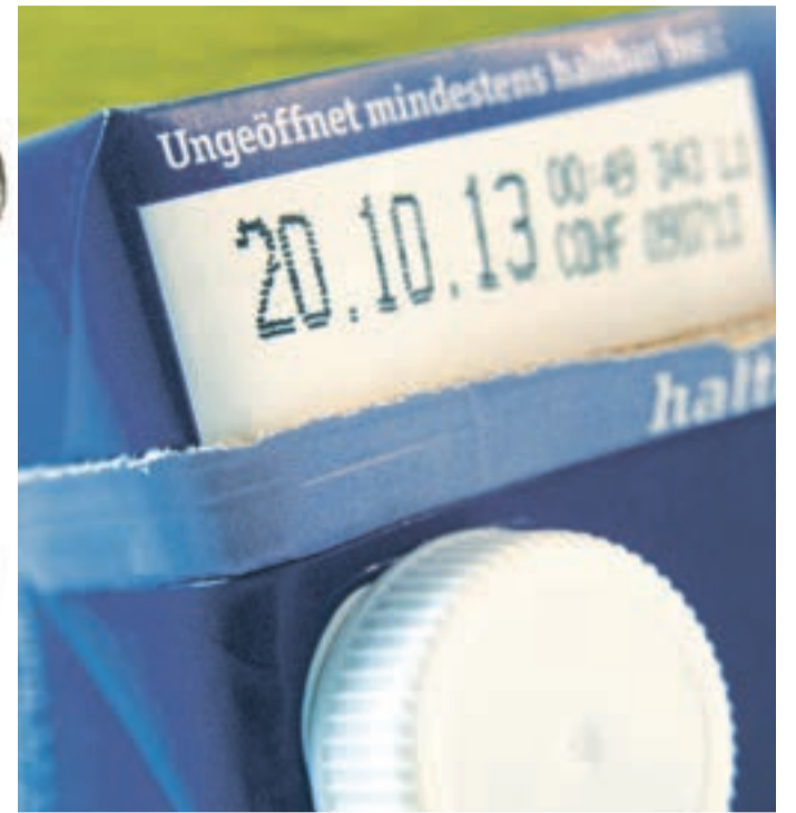
Zu viele Lebensmittel landen auf dem Müll