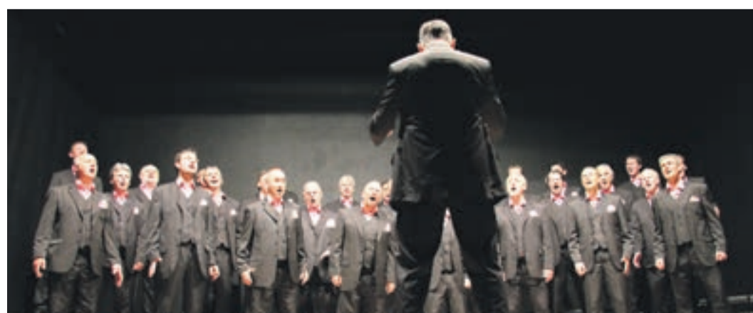
Für jeden Geschmack ist was dabei: In Waldkirchen kann man die Stadtkapelle Waldkirchen (oben), die Salsa-Band Los Dos Y Compañeros (Mitte) und den Männergesangsverein Herrenbesuch (unten) im Bürgerhaus erleben.