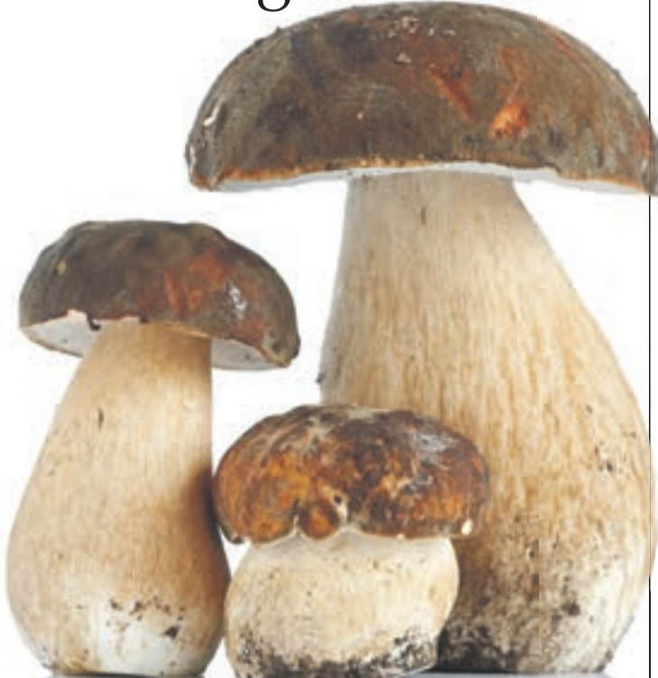
Bei Sammlern begehrt: der Steinpilz; Foto: © Scarpi

Der Dobernigl heißt Dobernigl – und aus! Oder haben Sie sich mal Gedanken gemacht, warum der Steinpilz bei uns so heißt? Ich nicht. Das war schon immer so. Seit einem Beisammensein mit Freunden interessiert's mich aber. Eine Freundin – aus einer Vorwald-Gemeinde im Nachbar-Landkreis Passau stammend – hatte das Thema aufgegriffen.