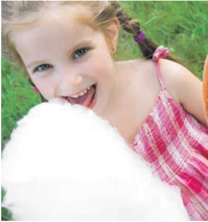
Zuckerwatte ist besonders beliebt bei Kindern

Als Kind hat bestimmt jeder mal Zuckerwatte auf dem Volksfest probiert. Sie ist klebrig und zergeht in Sekundenschnelle, wenn man sie in den Mund steckt. Zu ihrer Herstellung ist eine spezielle Maschine notwendig. Für eine Portion braucht man ein paar Gramm Haushaltszucker. Er wird in dem meist schüsselförmigen Gerät erhitzt, bis er flüssig ist. In der Mitte dreht sich eine heiße Scheibe so schnell, dass der flüssige Zucker weggeschleudert wird. Sobald er die „heiße Zone“ verlassen hat, erstarrt er zu Fäden, die mit einem Stab aufgewickelt werden. Sie sind weich wie Watte. Daher kommt der Name der Zuckerwatte. Auf den Volksfesten sind manchmal richtige Künstler zu finden, die aus den Fäden zum Beispiel eine Blüte formen. Angeblich hat es schon im 16. und 17. Jahrhundert Zuckerwatte gegeben.