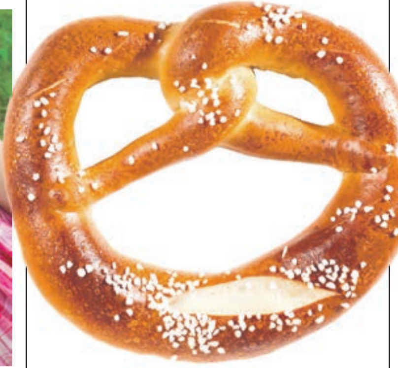
Wo ist bei der Breze oben und wo unten?

Die Laugen-Breze ist der Allrounder auf einem Volksfest. Sie schmeckt „solo“, sie ist fast mit allem kombinierbar und weist auch sonst äußerst praktische Eigenschaften auf. Sie sättigt, sie ist saugfähig und erfordert außer den eigenen Zähnen kein Werkzeug. Das haben schon zig Generationen vor uns erkannt. Bereits die Christen im 8. Jahrhundert v. Chr. sollen Brezeln gebacken haben. Und auf Zeichnungen vom Abendmahl, die aus dem Mittelalter stammen, ist die Brezel bereits in ihrer heutigen geschwungenen Form zu sehen. Keiner weiß aber genau, wie sie entstanden ist. Mehrere Quellen gehen davon aus, dass das Gebäck einen Mönch mit verschlungenen Armen darstellen sollte und ursprünglich auf lateinisch „brachitum“ (zu deutsch Arm) hieß. Später soll in unserer Sprache daraus die Breze(l) geworden sein.