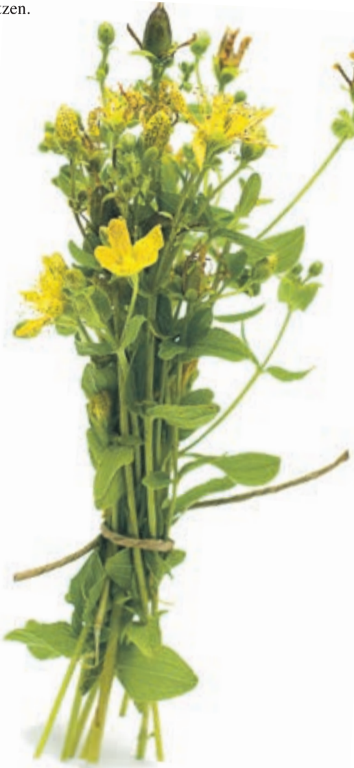
Das vielseitige Johanniskraut, Foto: © Artmim

Wer Kräuter mag und sich mit ihnen auskennt, hat die Natur zum Freund. Der braucht nicht wegen jedem Wehwechen in die Apotheke zu rennen, dem reicht oft der Weg in den eigenen Garten. Der wird auch nicht jammern, dass außer Leitungswasser nichts mehr zu trinken im Haus ist, sondern kurzerhand eine würzige Bowle ansetzen.