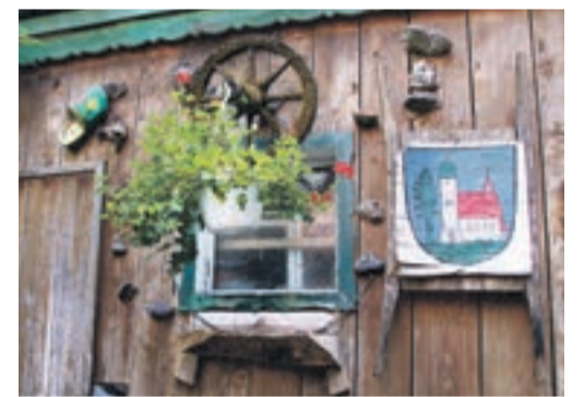
Das Waldkirchner Stadtwappen hat einen festen Platz auf dem urig gestalteten Freigelände.

nal, der oberhalb der Böschung entlang läuft. „Der ist jetzt besser gesichert.“