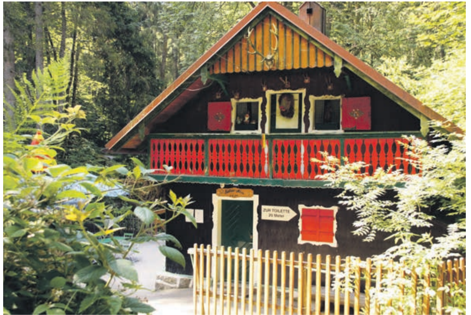
Einzigartig und Generationen überdauernd: Die Halleralm ist seit Jahrzehnten ein beliebter Ausflugsort in der Saußbachklamm, © Fotos Mertl

Gut in Erinnerung geblieben ist ihr auch eine Hochzeit, die in der Halleralm mit Musik und allem Drum und Dran gefeiert wurde. Da stand draußen noch eine Hütte, in der die Festgesellschaft überdacht sitzen konnte. Diese Hütte existiert heute nicht mehr. Sie ist vom Hochwasser weggerissen worden. 2002 war das: „In dem Jahr hat's uns zweimal erwischt“, erzählt die Wirtin. Umso erleichterter ist sie, dass der anhaltende Starkregen vor wenigen Wochen die Alm verschont hat. „2002 ist der Damm gebrochen“, erklärt sie und zeigt hinauf zum Ka-