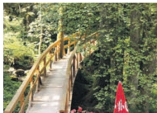
Eine Brücke über den Wildbach verbindet den Fußweg durch die Klamm und den Biergarten.