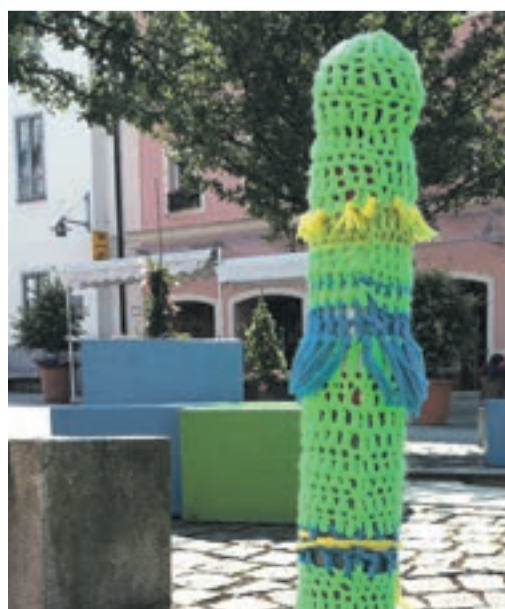
Bestrickter Poller am Marktplatz, Foto: © Stoiber

sammen und heckt neue, noch buntere, noch schönere Anschläge auf das Stadtzentrum aus, und es stellt sich uns die Frage, wird es bei dieser einstweilen noch harmlosen Variante bleiben, wird das Streben nach Veränderung sich auf die leblosen Dinge beschränken, oder wird es bald Personen treffen, dich oder mich oder