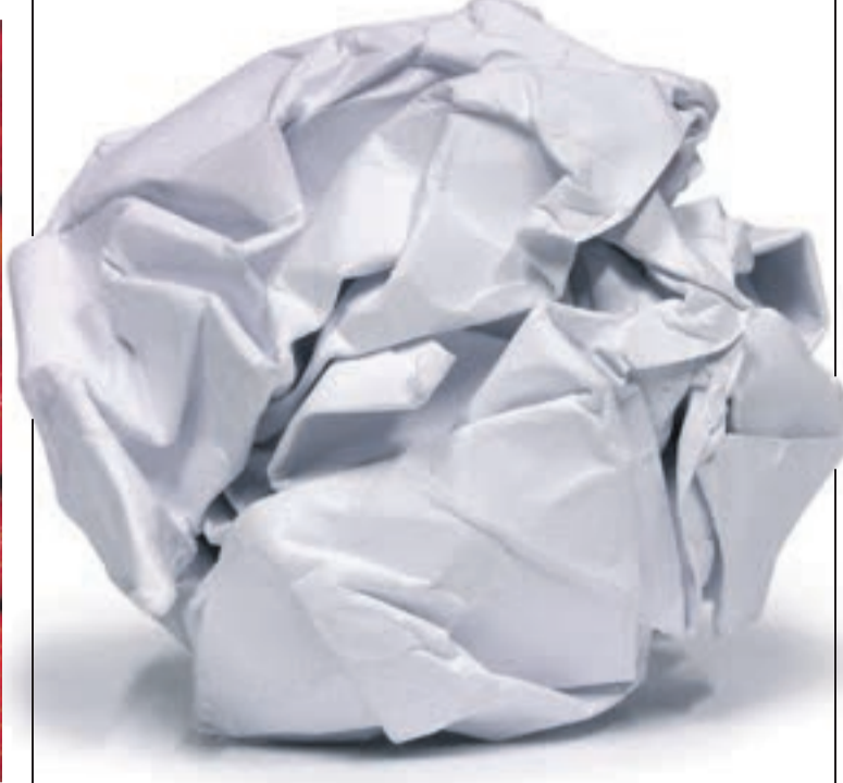
Aus Alt mach Neu – ein sinnvoller Kreislauf

Für die Verwendung von Recyclingpapier wirbt das Bundesumweltamt in der neuen Broschüre „Papier. Wald und Klima schützen“. In einer Pressemitteilung heißt es: „Recyclingpapier überzeugt mit optimaler Funktionalität und weniger Umweltbelastungen, spart gegenüber Primärfaser-Papieren bis zu 60 Prozent Energie, 70 Prozent Wasser, verringert Abfall und Emissionen.“ Auch die Druckqualität leide nicht, was das Amt mit der Broschüre auch gleich unter Beweis stellen wollte.