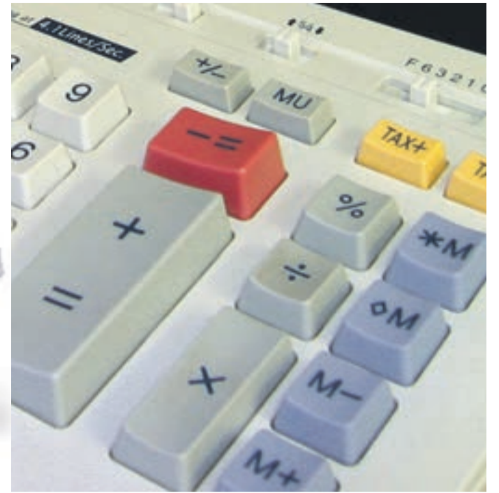
Hilfreich bei der ersten Bürokratiehürde des Jahres, Foto: © Shaw

Stichtag 31. Mai – Die letzten Schneeränder sind endgültig von den Straßenrändern verschwunden und unsere Berge in der Nachbarschaft haben ihre weißen Gipfel gegen ein zartes Grün getauscht – alles ist nun scheinbar endgültig aus dem langen Winterschlaf erwacht und sonnt sich in guter Laune. Doch schon versucht uns ein markantes Datum die Frühlingsgefühle zu verderben: der 31. Mai rückt gnadenlos näher und mit ihm die Bürokratiehürde des Jahres namens „Einkommensteuererklärung“.