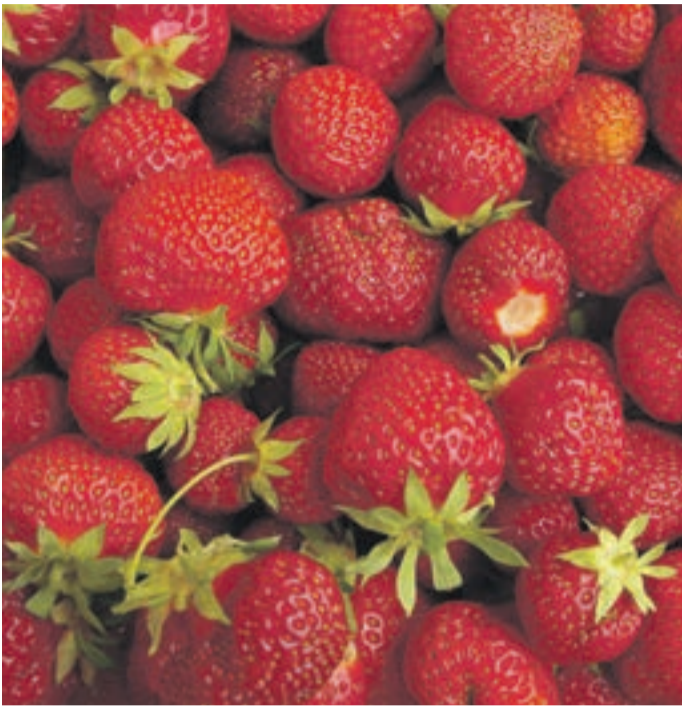
Gesund und kalorienarm, Foto: © Kanjepe

Bei allen Obst- und Gemüsesorten heißt saisonal geerntet, dass die reifen Früchte nur kurze Transportwege haben. Bei Erdbeeren bedeutet dies: mehr Geschmack und mehr wertvolle Inhaltsstoffe. Um den Monatswechsel zum Juni herum gibt es die ersten einheimischen Erdbeeren. Im Unterschied zu vielen anderen Früchten reifen Erdbeeren nicht nach. „Das heißt, je länger der Transportweg, desto unreifer müssen die Früchte geerntet werden – und umso weniger reif und süß sind sie, wenn sie beim Verbraucher ankommen,“ erklärt Maria Schmid von der AOK-Direktion Bayerwald.