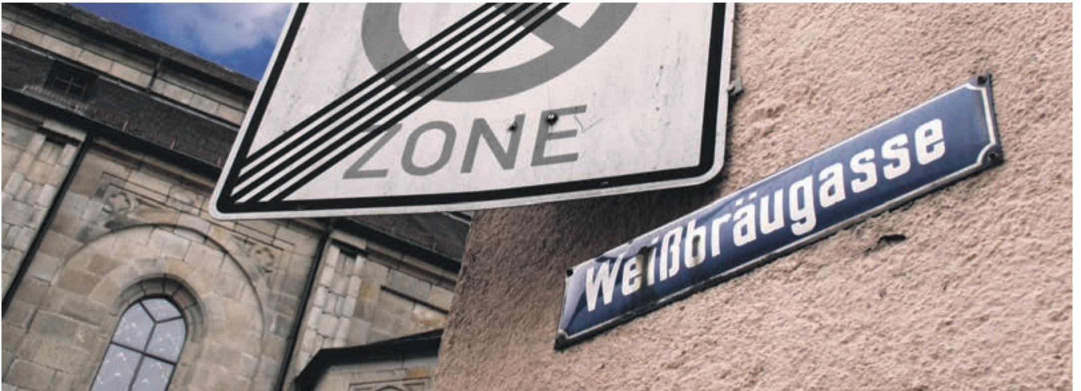
Straßennamen wie der von der Weißbräugasse zeugen von einst erfolgreichen Brauerei-Zeiten in Waldkirchen, Foto: © Mertl

Straßennamen weisen auf die vergangene Bierbrau-Tradition hin