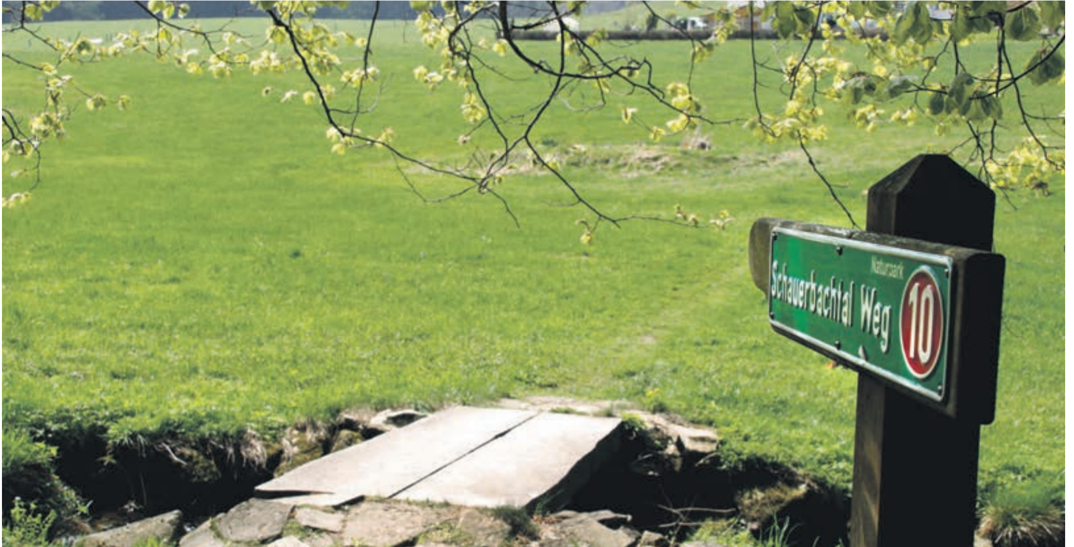
Der Weg durchs Schauerbachtal ist ein ausgewiesener Wanderweg. Das Schild lotst den Wanderer über die steinerne Brücke

Eine romantische Wanderung durch Wald und Wiesen – Ausgangspunkt ist der Erlauzwiesler See