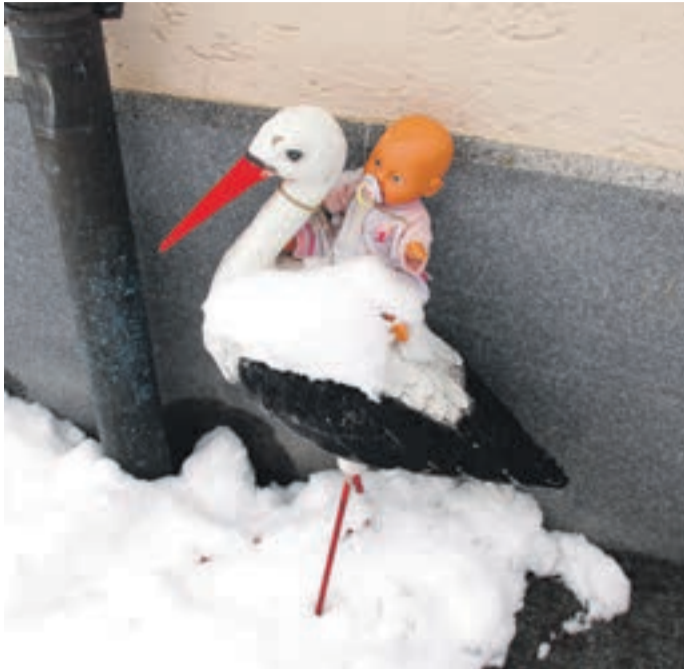
Schnee-Opfer in der Chorreihe