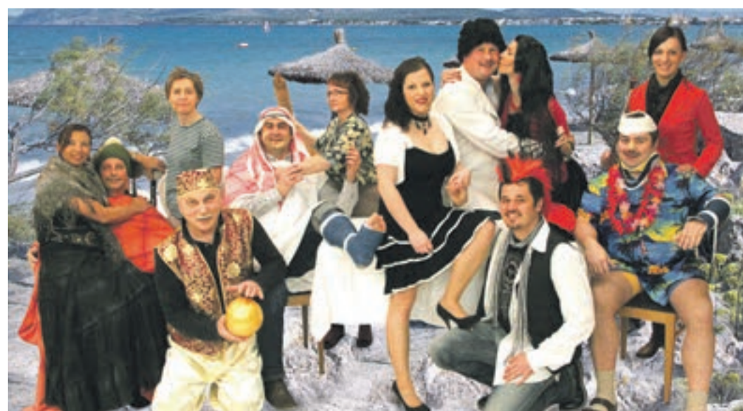
Mit bunten Kostümen auf die Bühne: die Laienschauspieler des Heimatvereins

Aufführungstermine: Premiere: Fr., 22. März; Sa., 23. März; Ostersonntag, 31. März, Ostermontag, 1. April, Fr., 5. April und Sa., 6. April. Beginn jeweils um 19.30 Uhr im Eckerl-Saal in Böhmzwiesel. Platzreservierung unter 08581-3370.