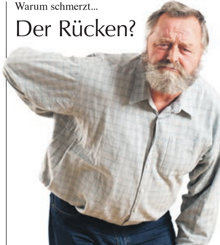
Das Kreuz mit dem Rücken

Jeder zweite Deutsche kennt Rückenschmerzen , fast jeder Dritte war deshalb schon einmal beim Arzt. Rückenbeschwerden haben viele Ursachen.