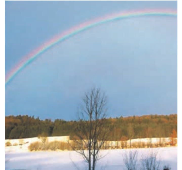
Ende Januar am Waldkirchner Himmel

Jeder hat schon mal einen Regenbogen gesehen. Selbst Kleinkinder kennen ihn wohl von ihrem Spielzeug, noch bevor sie die Gelegenheit hatten, einen echten wahrzunehmen, so sehr gehört er zum kulturellen Inventar. Doch was ist ein Regenbogen rein physikalisch, und gibt es Tipps und Tricks für Regenbogen-Sucher? Ja, letztere gibt es, doch der Reihe nach.