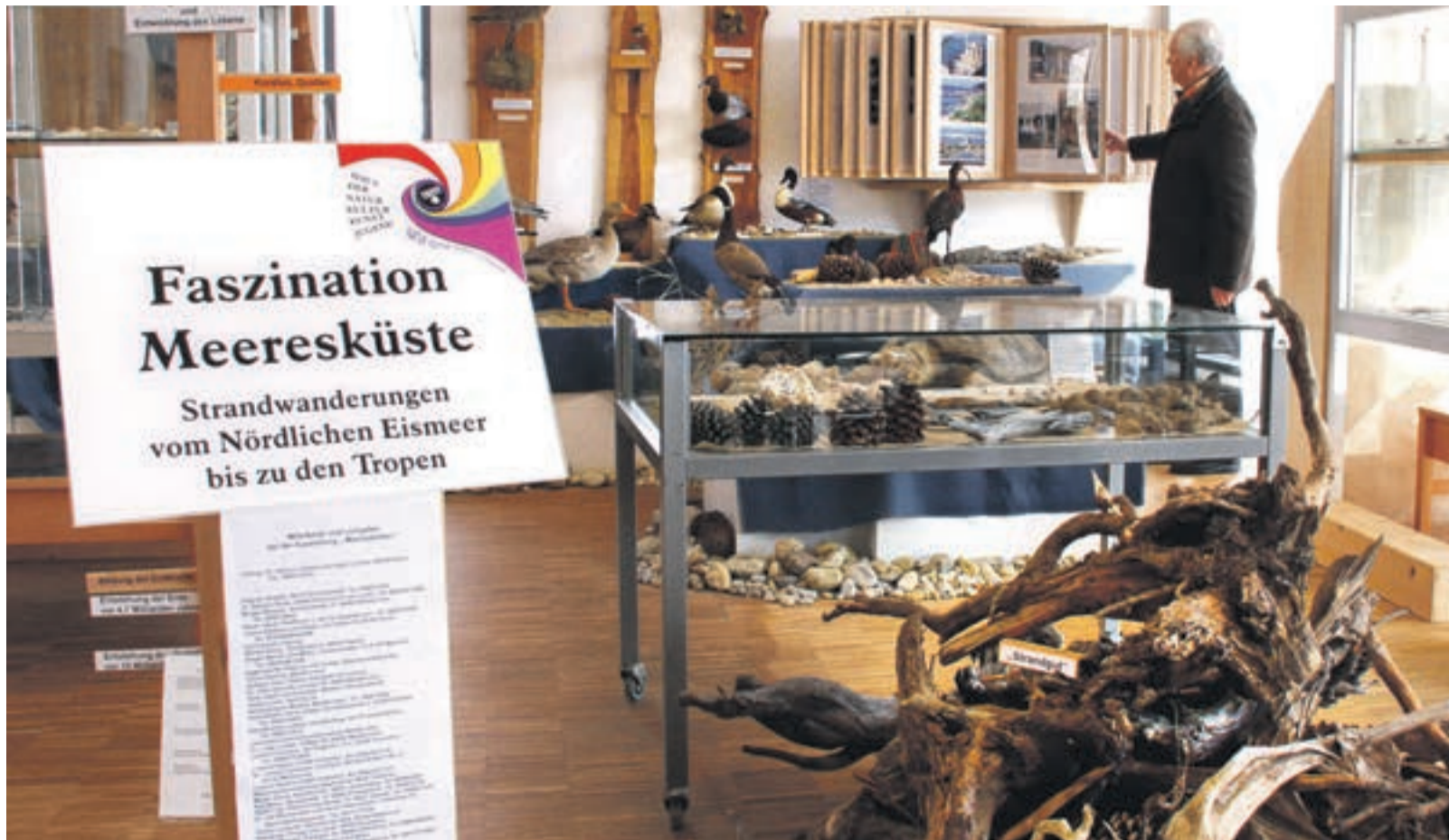
„Faszination Küste“: Die Ausstellung in den Licht durchfluteten Räumen des HNKKJ ist schon fix und fertig aufgebaut. Unter anderem wird auch eine Riesenschnecke gezeigt (kleines Bild), die bis zu 400 Kilogramm schwer werden kann, Fotos: © Mertl

Das HNKKJ eröffnet neue Dauerausstellung „Faszination Küste“ – Im März werden auch „Weltraumbilder“ gezeigt