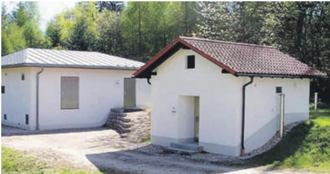
Der Hochbehälter auf dem Karoli

Auf europäischer Ebene ist eine Konzessionsrichtlinie für die Vergabe von Dienstleistungskonzessionen auch für Trinkwasser geplant. Damit wächst die Sorge in der Bevölkerung, dass in Folge einer möglichen Privatisierung die Wasserversorgung in Qualität, Preis und Zuverlässigkeit nachlassen und vor allem bei Störungen kein Ansprechpartner vor Ort mehr zur Verfügung stehen wird. Die Sorgen sind unbegründet, denn die Versorgung der Waldkirchner Haushalte wird auch künftig über die