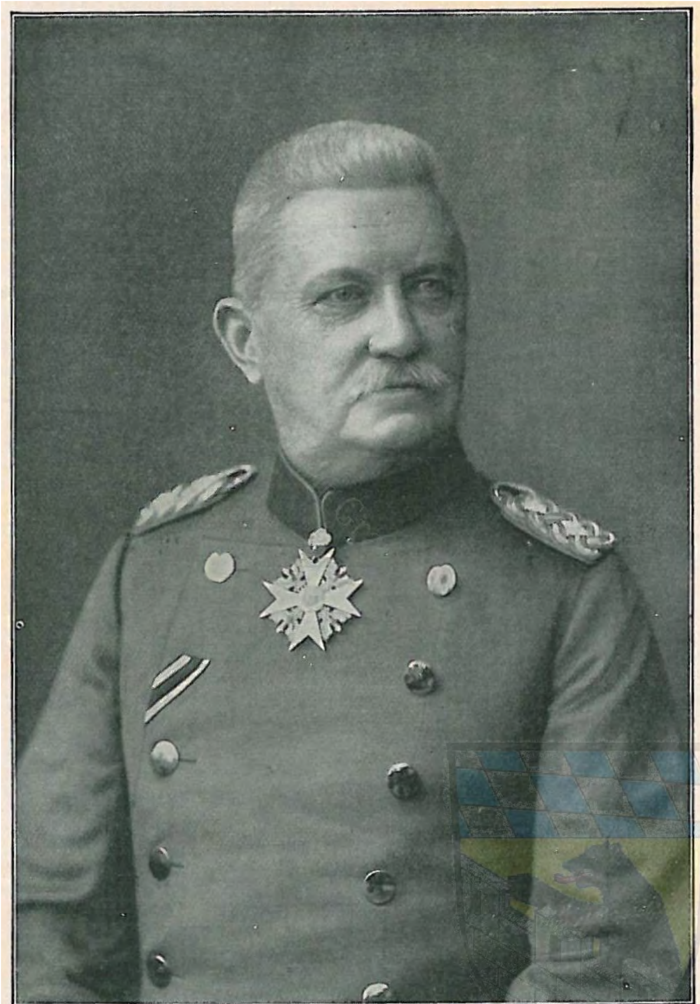
Generaloberst v. Bülow.